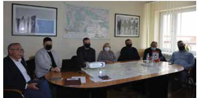
Dzięki środkom pozyskanym z Programu Inwestycji Strategicznych Polski Ład do istniejącego budynku szkoły w Woli Kopcowej dobudowana zostanie sala gimnastyczna.

- Spotkanie było niezbędne do podjęcia dalszych działań projektowych i budowlanych. Dziękuję uczestnikom za konstruktyw-