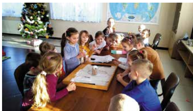
Wśród propozycji znalazły się m.in. zaskakujące doświadczenia.