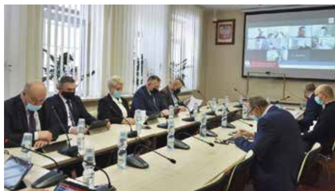
Zdecydowano m.in. o dołożeniu niemal 117 tysięcy złotych do systemu gospodarowania odpadami komunalnymi na rok 2022 z dochodów własnych.