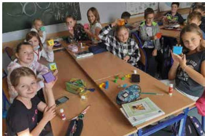
Dzięki pozyskanym środkom z fundacji mBanku w placówce zapanował iście artystyczny klimat w duchu matematycznym.