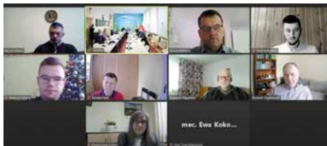
Radni po raz pierwszy obradowali w 2022 roku.

Wprowadzono zmiany do budżetu oraz Wieloletniej Prognozy Finansowej Gminy Masłów na lata 2022 – 2029. Nowe zadania do realizacji w bieżącym roku, to: wsparcie projektu Erasmus +, który przeprowadzi Szkoła Podstawowa im. Stefana Żeromskiego w Mąchocicach-Scholasterii, polega ona na zagranicznych szkoleniach dla nauczycieli oraz budowa odcinka sieci kanalizacji sanitarnej Dąbro-