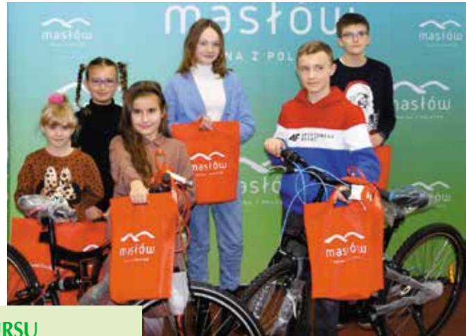
Laureaci konkursu mogą być z siebie dumni!

Hasłem przewodnim spotkania była walka ze smogiem w Górach Świętokrzyskich i pobudzenie aktywnej postawy uczniów w temacie ekologii, a w szczególności ochrony powietrza. W trakcie spotkania uczestnicy wspólnie obejrzeli film edukacyjny „Co to jest