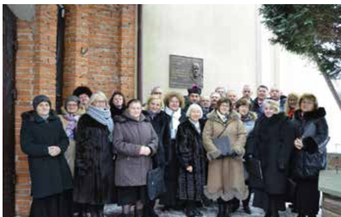
W uroczystościach wziął udział Chór Masłowianie.

We mszy świętej udział wzięli przedstawiciele OSP Brzezinki i Ciekoty oraz zespołów ludowych działających w gminie Masłów, nie tylko na terenie parafii. W strojach ludowych obecni byli członkowie Zespołu Pieśni i Tańca Ciekoty, Zespołu Pieśni i Tańca Żeromszczyzna, Brzeziniarki, Barczanki, Dąbrowianki, Żeromszczyzanki.