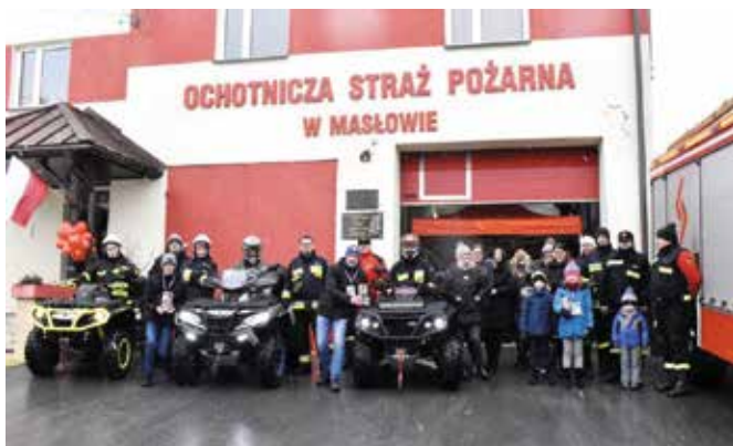
Masłów włączył się do orkiestry wielkich serc.