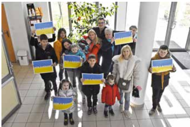
Zajęcia dla dzieci przygotowało Centrum Edukacji i Kultury „Szklany Dom”.