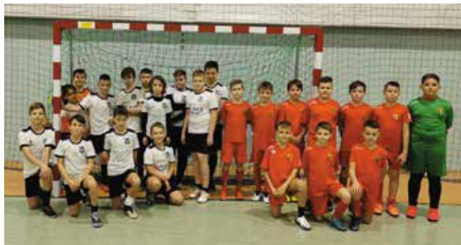
Niewątpliwie największymi sukcesami mogą pochwalić się zawodnicy z grupy trampkarzy.