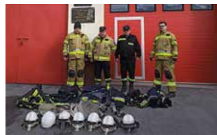
Jednostki OSP z gminy Masłów przekazały sprzęt ratowniczy z przeznaczeniem dla ukraińskich strażaków.

Młodzi Ukraińcy rozpoczęli również naukę. - Szkoła w Scholasterii, jako pierwsza w regionie przyjęła tak dużą grupę ukraińskich dzieci. Naukę rozpoczęły tu 33 osoby. Następne szkoły w województwie będą