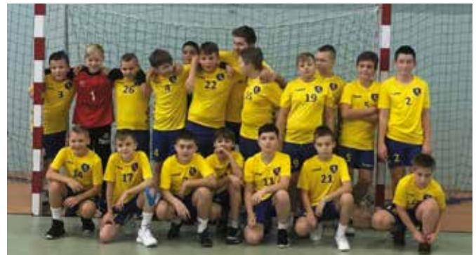
Przed naszą drużyną kolejne wyzwania.

- Na przestrzeni tych kilku miesięcy chłopcy intensywnie i ciężko pracowali, żyli się ze sobą i poczynili duże postępy, opanowali zasady gry, bezpieczeństwa i sędziowania zawodów piłki ręcznej, kształtowali samodyscyplinę i poszanowanie wspólnego mienia. Mają już za sobą udział w dwóch turniejach Ligii Świętokrzyskiej, z których drugi okazał się bardzo szczęśliwy dla naszych małych zawodników. Dziękujemy rodzicom, którzy przez cały ten