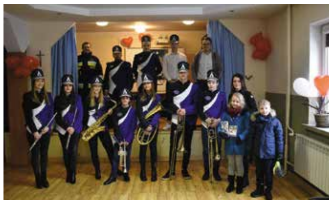
Zagrała Młodzieżowa Orkiestra Dęta z Masłowa.