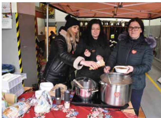
Czarcie Babki częstowały czarcią parzyjapą.