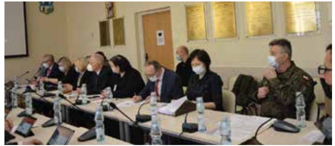
Ważnym punktem było głosowanie nad nadaniem szkole w Woli Kopcowej imienia Janusza Korczaka.