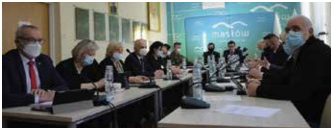
Ważnym zadaniem będzie opracowanie programu funkcjonalno-użytkowego „Zagospodarowania centrum Masłowa Pierwszego”, który zaplanuje przestrzeń m.in. na działkach pozyskanych od samorządu województwa.

W kolejnym punkcie przedstawiono informację o stanie mienia komunalnego – gruntach. Obecnie gmina Masłów na własność posiada 152 ha 6972 m 2 , w użytkowaniu wieczystym są 2 ha 1355 m 2 , nieruchomości przekazane w użytkowanie wieczyste 3442 m 2 , a nieruchomości oddane w trwały zarządek stanowią 6 ha 0243 m 2 . Szczegółowe dane dotyczące mienia gminnego w każdym sołectwie znajdują się w portalu www.maslow.esesja.pl