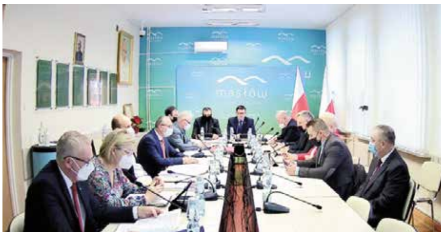
Najważniejszym punktem było przyjęcie budżetu.

Wśród najważniejszych inwestycji, które znalazły się w budżecie są budowa sali gimnastycznej przy szkole w Woli Kopcowej, przebudowa drogi wraz z odwodnieniem – ul. Szkolnej w Mąchocicach Kapitulnych (finansowane z programu rządowego Polski Ład w wysokości 95 procent wartości inwestycji), przebudowa ul. Letniskowej w Woli Kopcowej (z Rządowego Funduszu Rozwoju Dróg), budowa ul. Malinowej w Domaszowicach wraz z chodnikiem, projekt budowlany z budową drogi gminnej z chodnikami i odwodnieniem na Podklonówce II (zadanie dwuletnie), wspólnie z Powiatem Kieleckim budowa ostatniego etapu ścieżki rowerowej w przełomie Lubrzanki, przebudowa amfiteatru wraz z wyposażaniem Centrum Edukacji i Kultury „Szklany Dom” w Ciekotach (dofinansowanie z unijnego programu PROW), termomodernizacja ważnych obiektów: Urząd Gminy w Masłowie i Szkoła Podstawowa im. Marii Skłodowskiej-Curie w Mąchocicach Kapitulnych (zakładana dotacja blisko 3 mld zł), zakup sprzętu i zabezpieczenie sieci komputerowych (program Cyfrowa Gmina), zakup mikrobusa dla osób niepełnosprawnych. Kontynuowana będzie modernizacja ciągników oświetleniowych, w budżecie znalazło się kilkanaście odcinków oczekiwanych przez mieszkańców. Realizowane będą zadania wybrane w czasie zebrań w ramach funduszu sołeckiego. Przeznaczono na to ponad 400 000 zł. Ważne jest to, że pierwotnie wpisane zadania na fundusz w Domaszowicach, zgodne z prawem, zostaną realizowane ze środków budżetu i zostały do niego wpisane.