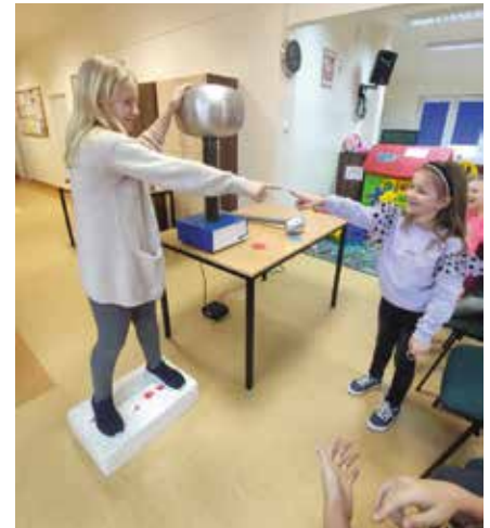
Nie zabrakło ciekawych doświadczeń.

Dzieciaki mogły wziąć udział w pouczających warsztatach na temat nie marnowania żywności, były wyjścia do kina, bawialni, zabawy z edukido, spotkanie z Panem Pytalskim, malowanie farbami, gry planszowe, zagadki i quizy.