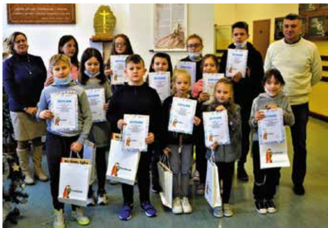
Uczestnicy projektu otrzymali pamiątkowe dyplomy.

Uczniowie, w ramach projektu, wcielając się w detektywów rozwiązywali różne problemy matematyczne. Badali właściwości trójkątów, uczyli się gospodarować czasem, rozwijali umiejętność posługiwania się pieniędzmi oraz brali udział w matematycznej grze terenowej z wykorzystaniem aplikacji „Actionbound”. Brali również udział w turnieju gier i łamigłówek matematycznych. Najbardziej aktywni i zaangażowani uczestnicy projektu otrzymali upominki ufundowane przez organizatora – mFundację.