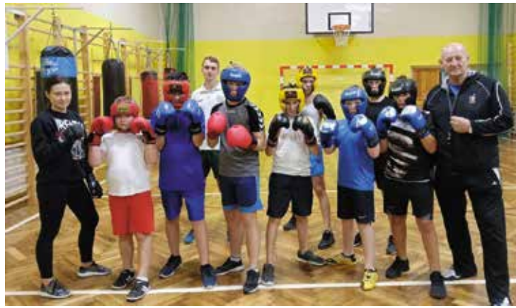
Nabór chętnych trenujących boks dla dzieci i młodzieży trwa przez cały rok.

lowa Wola: 2 złote medale, 2 srebrne medale, - Ostrów/Skrzeszów: 2 złote medale, 3 srebrne medale, - Dębica: 3 złote medale, 1 srebrny medal; Mistrzostwach Okręgu ŚOZB – Skarżysko-Kamienna: 3 złote medale, 1 srebrny medal, 2 brązowe medale; Ogólnopolskim Turnieju o Puchar Województwa Łódzkiego – Opoczno: 3 złote medale; Młodzieżowych Mistrzostwach Polski – Wałcz: miejsce od 4-8; Turnieju Bokserskim- Świętokrzyskie vs Lubelskie: 2 złote medale, 1 srebrny; Gali Boks – Opoczno: 3 złote medale, 3 srebrne medale. Ogólnie zawodnicy K.S. „Skalnik” podczas realizacji zadania publicznego zdobyli: 18 złotych medali, 11 srebrnych