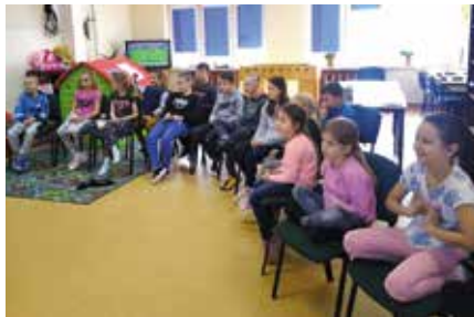
Dzieciaki były zadowolone.

Zdecydowanie największą frajdę sprawiło wszystkim malowanie farbami swojej bajkowej postaci oraz zadania zręcznościowe. Dzieci zmierzyły się z oddzielaniem fasoli od grochu oraz układaniem wieży z drewnianych klocków. Przygotowany program okazał się dla małych czytelników strzałem w dziesiątkę.