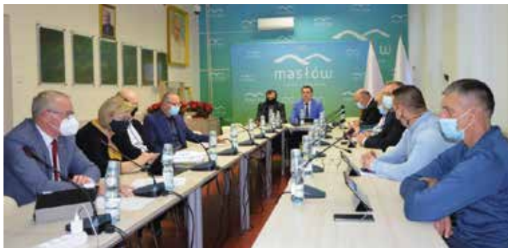
Podjęcie uchwały było konieczne ze względu na zwiększenie ilości odbieranych odpadów komunalnych.

Podjęcie uchwały było konieczne ze względu na zwiększenie ilości odbieranych odpadów komunalnych. Ilość odbieranych odpadów od mieszkańców gminy Masłów, zakładana do przetargu, w porównaniu z rokiem 2020 znacznie wzrosła m.in. średnio o ponad 28 ton (dotyczy to frakcji bio), o średnio ponad 19 ton (frakcja zmieszana), a średnio o ponad 12 ton (frakcja tworzywa sztuczne). Znaczny wzrost ilości oddawanych odpadów zauważono również w Punkcie Selektywnej Zbiórki Opadów Komunalnych w Dąbrowie. Przypomnijmy, że system odbioru odpadów jest zorganizowany w dwojaki sposób. Łączy się z wyborem firmy transportującej odpady oraz firmy zagospodarowującej je w Promniku. Dzięki temu Gmina Masłów płaci za rzeczywistą ilość oddanych odpadów. Radni chcąc uniknąć zdecydowanej podwyżki podjęli w cza-