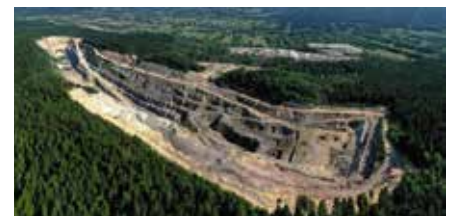
Tereny kopalni EUROVIA z lotu ptaka.

Warto dodać, że to nie pierwsza i nie ostatnia taka wizyta w Wiśniówce. Kopalnia przyciąga studentów z całego kraju,