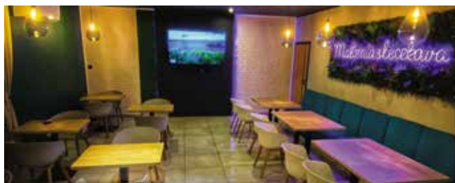
Tak wygląda nowa sala restauracyjna w Pizzerii Małomiasteczkowa, która zdobyła Nagrodę Gospodarczą Gminy Masłów 2021.

Zgłoszenia kandydatów należy dostarczyć pocztą lub osobiście do sekretariatu Urzędu Gminy Masłów do końca kwietnia. Wszystkie niezbędne informacje, regulamin i formularze można znaleźć na stronie internetowej Gminy Masłów lub odebrać osobiście w sekretariacie Urzędu Gminy. Wszystkie pytania związane