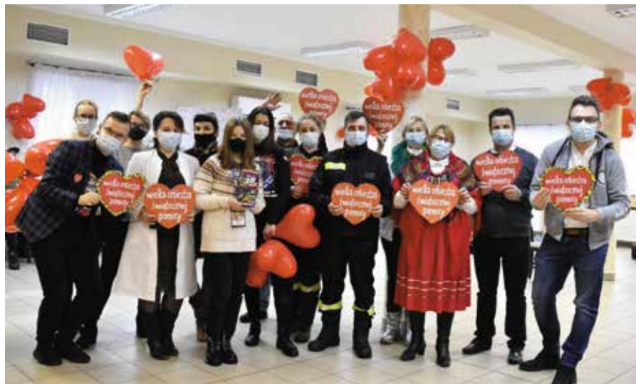
Po raz pierwszy granie odbyło się w Mąchocicach Kapitulnych.

- Bardzo serdecznie dziękujemy wszystkim, którzy wzięli udział w licytacji i tym, którzy podarowali fany. Wsparcie m.in. przedsiębiorców z gminy Masłów