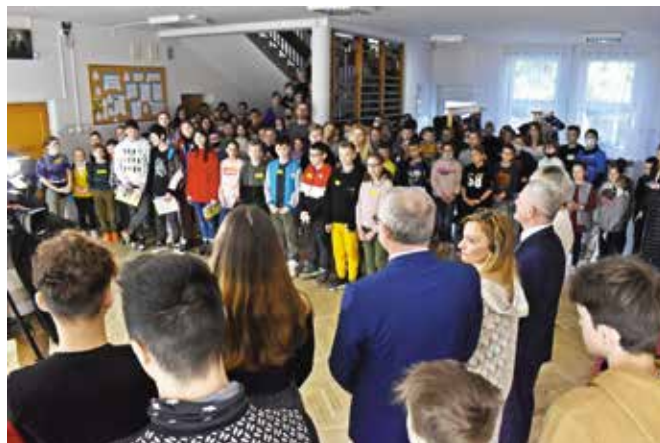
Uczniowie zostali przyjęci do szkoły w Mąchocicach-Scholasterii podczas okolicznościowego apelu.