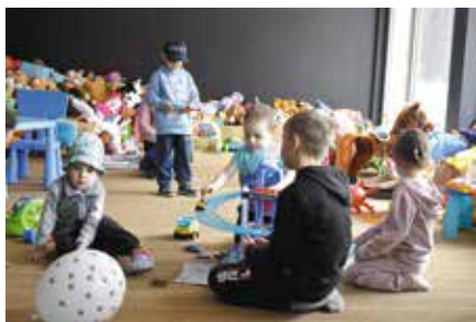
Sala zabaw w Hotelu Ameliówka wypełniona jest zabawkami.