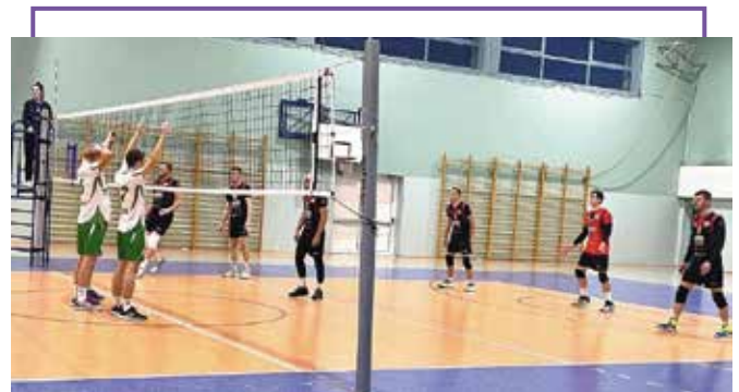
Dzięki dofinansowaniu z budżetu gminy dwie grupy męska i żeńska mogły trenować pod okiem wykwalifikowanych trenerów.

Grupa męska ubiegłoroczne rozgrywki zakończyła na fantastycznym 2 miejscu w IV lidze Świętokrzyskiej. Ten sezon rozpoczęliśmy w październiku i na półmetku rozgrywek zajmujemy wysokie drugie miejsce w swojej czwarto ligowej grupie. Zawod-