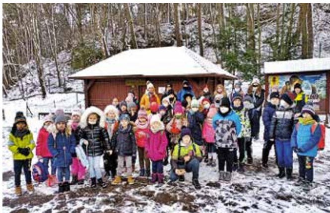
Wycieczka do Jaskini Raj przyniosła dzieciom wiele wrażeń.

W programie znalazły się zarówno zajęcia warsztatowe, jak i kulinarne oraz lubiane przez wszystkich wycieczki. Komplet uczestników wziął udział w wyjeździe „Śladem Przyrodniczych Osobliwości Świętokrzyskich”. Wszyscy zwiedzili Jaskinię Raj oraz Centrum Geoedukacji w Kielcach, gdzie z zaciekawieniem uczest-