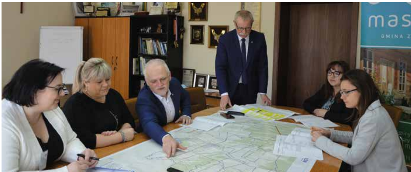
Praca zespołu nad wnioskami do II edycji Programu Inwestycji Strategicznych Polski Ład.

Znany projekt, które Gmina Masłów przygotowała do drugiego naboru wniosków o dofinansowanie do Programu Inwestycji Strategicznych Polski Ład złożonych przez Gminę Masłów tj.: dwóch wniosków na rozbudowę sieci wodno-kanalizacyjnej w Gminie Masłów oraz wniosku na Budowę Centrum Kulturalnego im. Józefa Piłsudskiego w Wiśniówce z OZE.