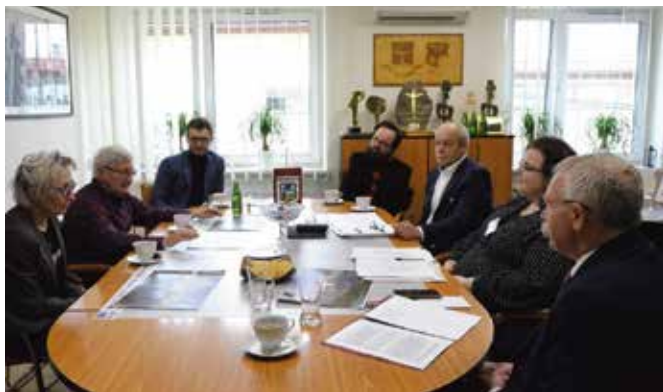
To było jedno z kolejnych spotkań dotyczących koncepcji wyposażenia.