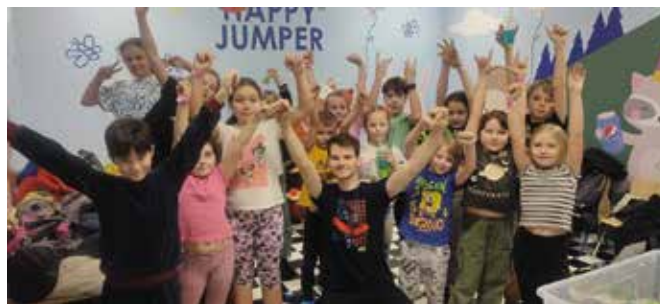
Była też wycieczka do parku trampolin.

zwycięzcy, których wylosował dyrektor szkoły otrzymali atrakcyjne nagrody.