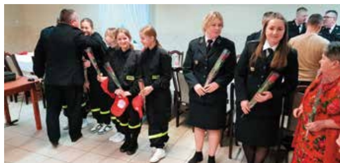
Z okazji Dnia Kobiet panie otrzymały symboliczne kwiaty.

Spotkanie było okazją do obejrzenia nowego, ciężkiego samochodu ratowniczo-gaśniczy marki Iveco, który w lutym trafił do jednostki w Mąchocicach Kapitulnych.