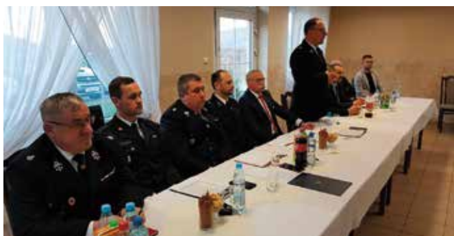
W ubiegłym roku jednostka pozyskała również m.in.: agregat prądowłóczy, ubrania bojowe, helmy, buty specjalne oraz laptop dla MDP.