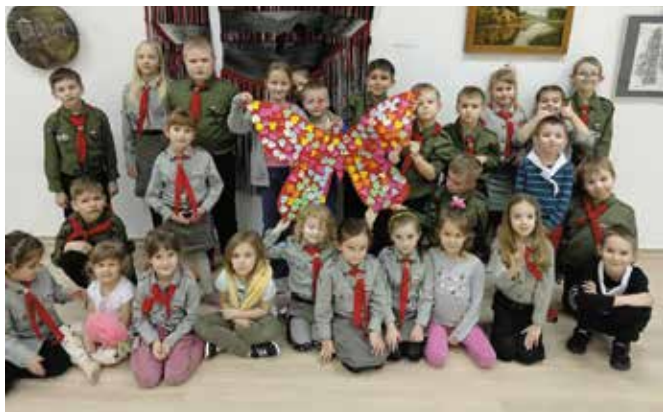
Zuchy z Ciekot bawiły się znakomicie.