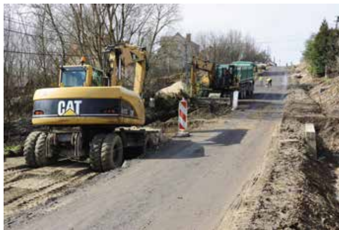
Część prac toczy się na ul. Krajobrazowej.

Za realizację zadania odpowiada Przedsiębiorstwo Robót Inżynierskich FART, a jego koszt to ponad 8 mln 350 tys. zł. Inwestycja jest realizowana przez Powiat Kielecki, który pozyskał na ten cel 60-procentowe dofinansowanie z Rządowego Funduszu Rozwoju Dróg. Pozostałą część kosztów pokryją samorządy gminy i powiatu w wysokości nieco ponad 2 mln zł każdy (20 procent każdy z samorządów).