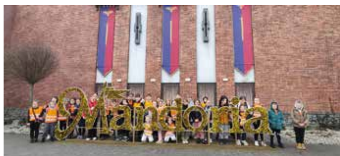
Z „Promyczkiem” odbyła się wycieczka do Mandorii.

Atrakcyjną ofertę dla najmłodszych przygotowała również Placówka Wsparcia Dziennego „Promyczek”, gdzie w pierwszym tygodniu ferii zajęcia odbyły się w formie półkolonii. Podopieczni „Promyczka” wzięli udział w atrakcyjnych wycieczkach: do parku trampolin Happy Jumper i Kina Helios, gdzie dzieci obejrzały bajkę „Emma i czarny jaguar”. Niezapomniane chwile uczestnicy pół-