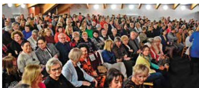
Sala była wypełniona do ostatniego miejsca.

Miłym akcentem było losowanie nagród. Do pań trafiły zestawy kosmetyków, zaproszenia do Kina Moskwa w Kielcach, vouchery na pierogi od SandroBaru w Woli Kopcowej, zaproszenia na obiad do MiniBistro w Masłowie Pierwszym. Później już scena nale-