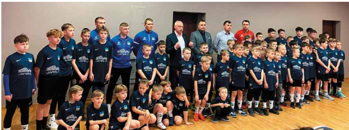
Najmłodszy sportowcy z gminy Masłów cieszyli się z nowych koszulek.