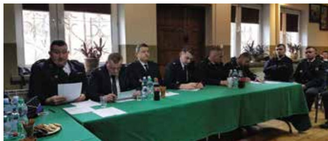
W ubiegłym roku jednostka OSP Masłów pozyskała m.in.: ubrania bojowe, mundury, ubrania koszarowe, buty specjalne oraz akumulatorowe narzędzie wielofunkcyjne.

Ochotnicza Straż Pożarna w Masłowie została założona w 1931 r. Obecnie liczy 44 członków, w tym 25 mogących brać bezpośredni udział w działaniach ratowniczych. Przy jednostce funkcjonuje młodzieżowa drużyna pożarnicza. Strażacy dysponują dwoma samochodami ratowniczo-gaśniczymi. Jednostka włączona jest do Krajowego Systemu Ratowniczo-Gaśniczego i stanowi ważne ogniwo w systemie bezpieczeństwa gminy Masłów oraz powiatu kieleckiego. W 2023 roku druhowie uczestniczyli łącznie w 34 akcjach ratowniczo-gaśniczych, w tym: 16 pożarach, 16 miejscowych zagrożeniach i otrzymali 2 fałszywe alarmy.