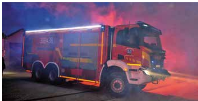
Tak prezentuje się nowy, ciężki wóz.

- Ciężki samochód marki Iveco o pojemności zbiornika na wodę 9 000 litrów zagwarantuje zaopatrzenie w wodę w miejscach, w których nie ma dostępu do sieci wodociągowej, takich jak tereny leśne, góryste, łąki, nieużytki, czy oddalone od niej zabudowania. Pozwoli skuteczniej gasić pożary w budynkach wielkopowierzchniowych, ale też będzie pomocny na wypadek awarii sieci wodociągowej – wyjaśnia wójt.