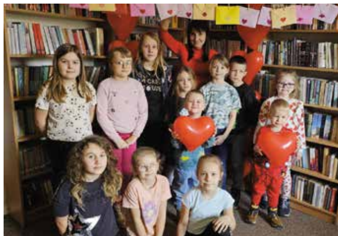
W bibliotece było bardzo walentynkowo.