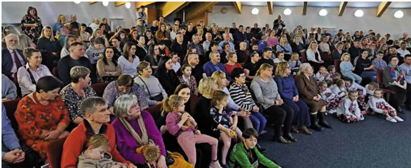
Widownia była wypełniona do ostatniego miejsca.