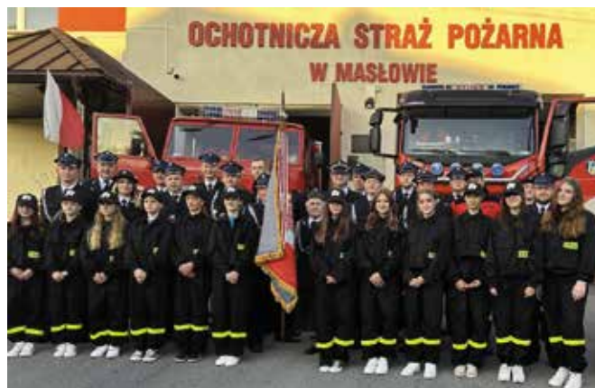
Druhny i druhowie z Masłowa będą cieszyć się z nowego lekkiego wozu ratowniczo-gaśniczego.

- Cieszy mnie, że udało się pozyskać dofinansowania, dzięki którym zwiększamy kwotę dofinansowania do ciężkiego samochodu i pozyskujemy aż 85 procent do wymiany ostatniego najstarszego wozu. Jednostki będą dysponować nowoczesnymi