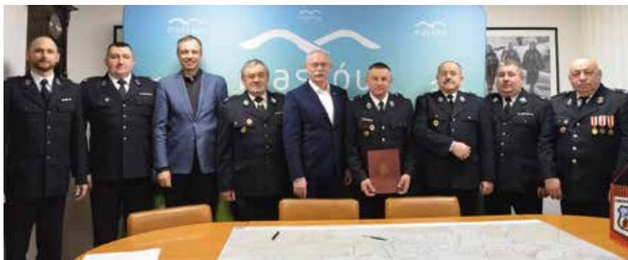
Umowy podpisano podczas spotkania w Urzędzie Gminy Masłów.