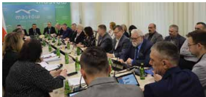
Radni zagłosowali za nowymi inwestycjami.