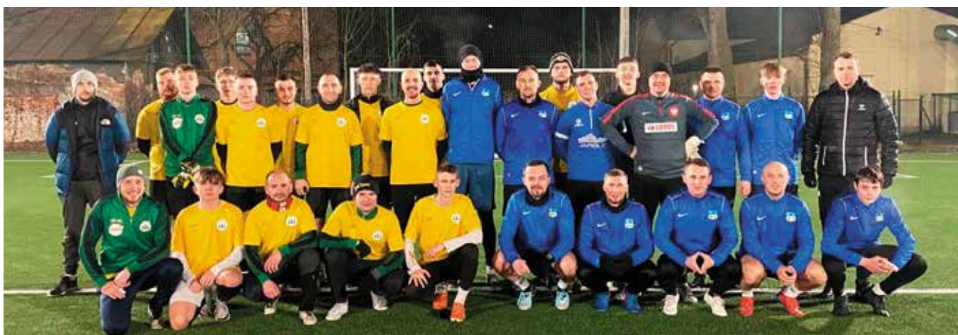
Nasi zawodnicy rozegrali mecz z drużyną Góral Żywiec.