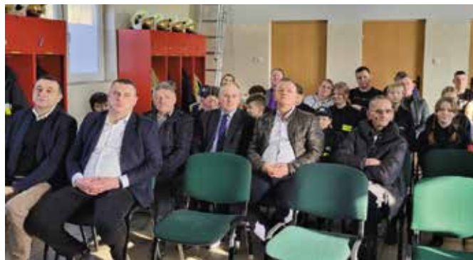
Zaproszeni goście docenili pracę i zaangażowanie druhów na rzecz podniesienia poziomu bezpieczeństwa pożarowego.