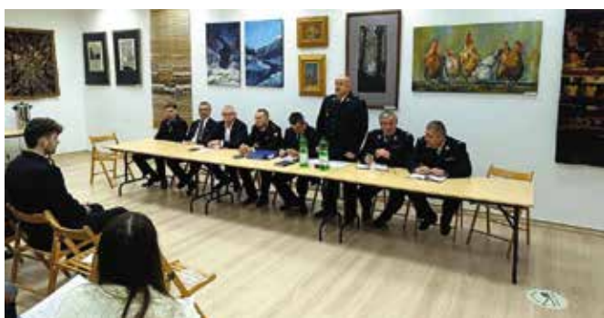
W ubiegłym roku jednostka pozyskała nowe sprzęty.

W ubiegłym roku jednostka OSP Ciekoty pozyskała: aparaty powietrzne, detektor wielogazowy, detektor napięcia, drabinę przenośną, pilarkę łańcuchową Stihl. W ubiegłym roku ruszyła także przebudowa i modernizacja strażnicy wraz ze świetlicą w Ciekotach.