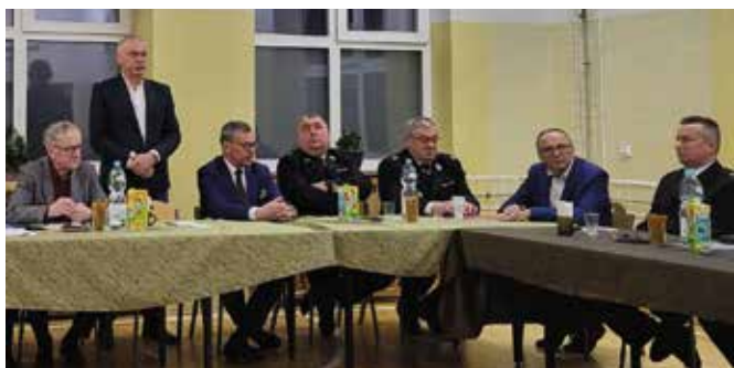
Jednostka OSP Brzezinki w ubiegłym roku uczestniczyła w czterech akcjach ratowniczo-gaśniczych.