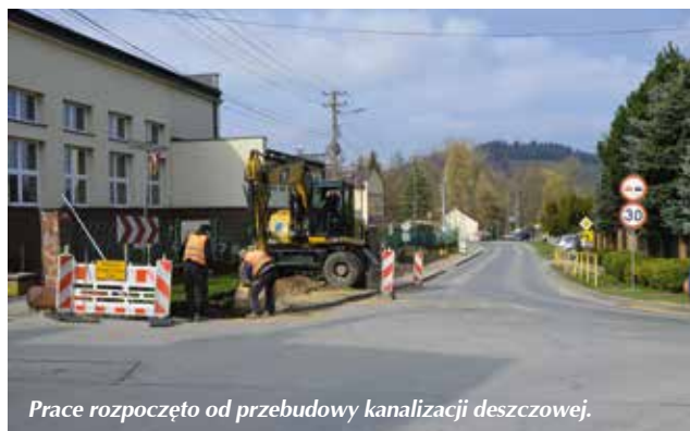
Prace rozpoczęto od przebudowy kanalizacji deszczowej.

Rozpoczęła się gruntowna przebudowa odcinka ulicy Jana Pawła II w Masłowie Pierwszym. Droga powiatowa na odcinku od ulicy Spacerowej do ulicy Spokojnej będzie poszerzona, zyska dodatkowy chodnik i wyniesione przejście dla pieszych.