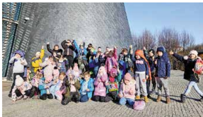
W Centrum Bajki w Pacanowie bawili się uczestnicy zajęć ze świetlic.