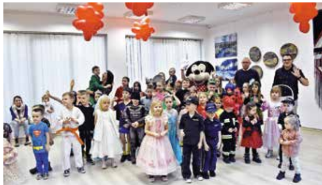
W „Szklanym Domu” odbył się wielki bal.