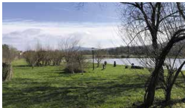
Na Żeromszczyźnie stanie ężnia solankowa.

- Gmina Masłów zawarła umowy z wykonawcami projektów, które dadzą zielone światło do realizacji tych inwestycji. Samorząd podpisał również umowę z firmą, która do końca czerwca zbuduje ogrodzenie