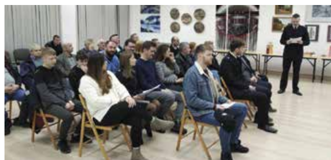
W roku 2023 druhowie z Ciekot interweniowali dziewięć razy, w tym w pięciu pożarach, 3 miejscowych zagrożeniach, jeden alarm okazał się fałszywy.

OSP w Ciekotach działa od 1960 r. Obecnie liczy 30 druhów, w tym 22 mogących brać bezpośredni udział w działaniach ratowniczych. Przy jednostce funkcjonuje Młodzieżowa Drużyna Pożarnicza. Jednostka jest włączona do Krajowego Systemu Ratowniczo-Gaśniczego i stanowi ważne ogniwo w systemie bezpieczeństwa gminy Masłów oraz powiatu kieleckiego. W roku 2023 druhowie z Ciekot interweniowali 9 razy, w tym w 5 pożarach, 3 miejscowych zagrożeniach, jeden alarm okazał się fałszywy.