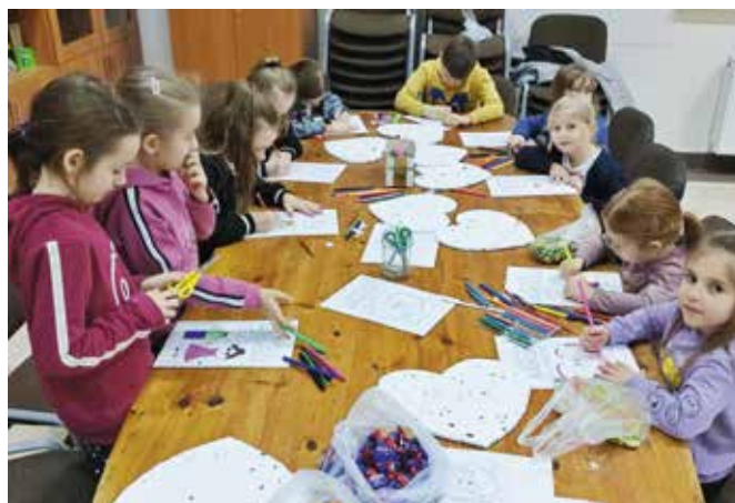
Na dzieci i młodzież będą czekały ciekawe zajęcia.

W ramach projektu, gdy zaistnieje potrzeba, z możliwości wsparcia psychologicznego czy pedagogicznego będą mogli skorzystać także rodzice uczestników. Świetlice będą funkcjonować codziennie w godzinach 14-18, w budynkach bezpłatnie uży-