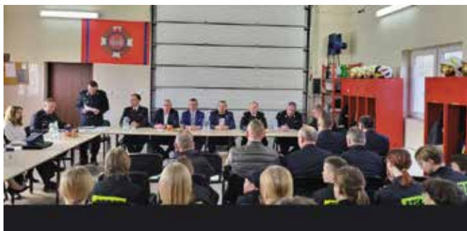
W roku 2023 jednostka uczestniczyła w 18 akcjach ratowniczo-gaśniczych.

Warto podkreślić, że w ubiegłym roku jednostka OSP Wola Kopcowa pozyskała nowy sprzęt, w tym m.in.: samochód rozpoznawczo-ratowniczy Nissan Navara, agregat prądowłoczy trójfazowy, przyczepkę podłodziową, myjkę ciśnieniową, ubrania specjalne 3 kpl., hełmy MDP 10 szt. W ubiegłym roku zainstalowany został monitoring wizyjny w remizie oraz na zewnątrz.