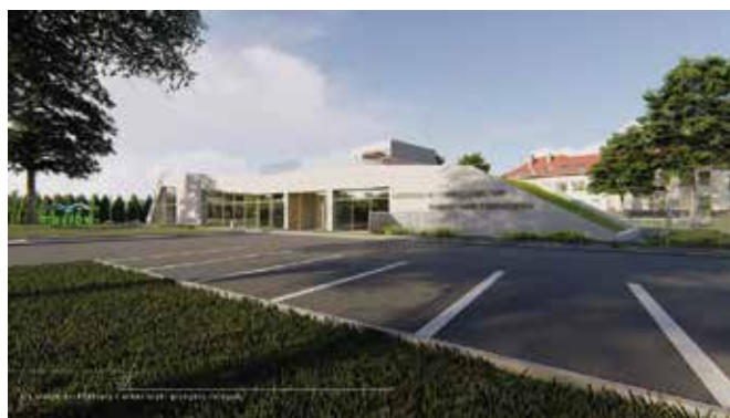
Centrum Historii Lotnictwa powstanie na działce pozyskanej od Samorządu Województwa Świętokrzyskiego, gdzie obecnie mieszczą się budynki magazynowe po lotnisku.