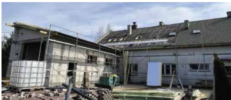
Ruszyły już prace w starej części budynku.

W ramach współpracy gminy Masłów ze Związkiem Gmin Gór Świętokrzyskich w ramach