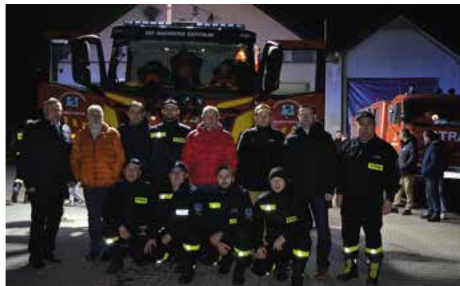
To dzień, który na zawsze zapisze się w historii jednostki.

- Jednostka OSP w Mąchocicach Kapitulnych jest jedną z podstaw gminy i powiatu kieleckiego jeśli chodzi o zabezpieczenie i ochronę pożarową. Cieszy fakt, że wśród nas jest obecna duża grupa członków mło-