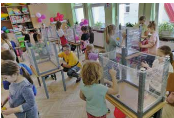
W szkołach czekały wyjątkowe zajęcia.