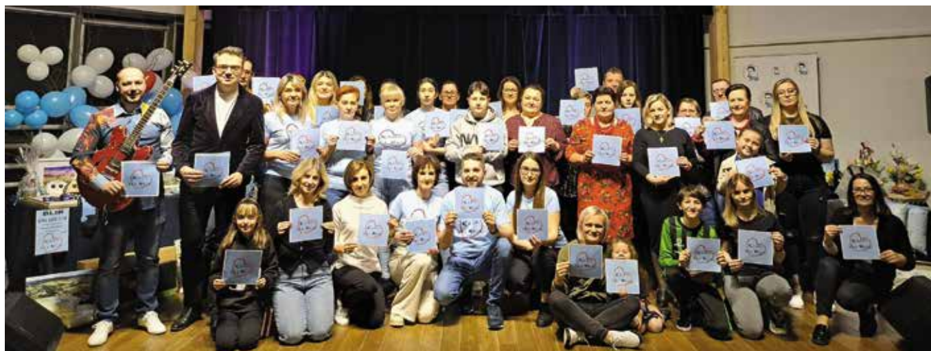
W organizację koncertu było zaangażowanych wielu mieszkańców gminy Masłów oraz ich przyjaciół.